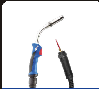
Mở hàn Aluminium MIG / MAG