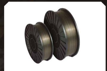
Dây thép flux-cored