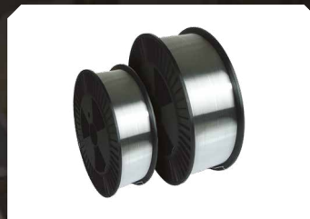
Dây Aluminium (AlMg5)