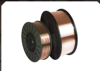
■ Dây thép (SG2) ■ Dây thép không gỉ (316LSi)