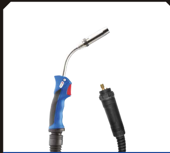
Thép/Thép không gỉ MIG / MAG mở hàn