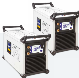
NEOPULSE 400 G 014497