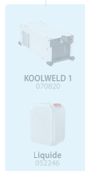
KOOLWELD 1 070820