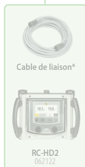
Cable de liaison*