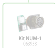
Kit NUM-1 063938