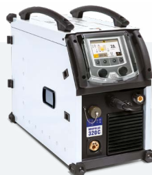
NEOPULSE 320 C 062474