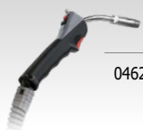
Push Pull Torch (24 B)