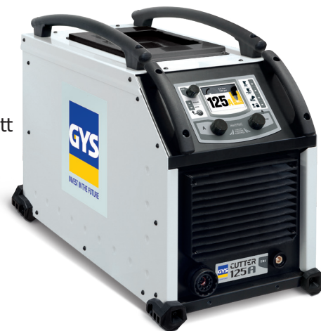
Levereras med jordklämma (4m, 16mm 2 )