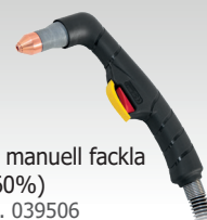
MT-125 manuell fackla 130A (60%) 6M - art. 039506 12m - art. 039513