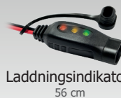
Laddningsindikator 56 cm