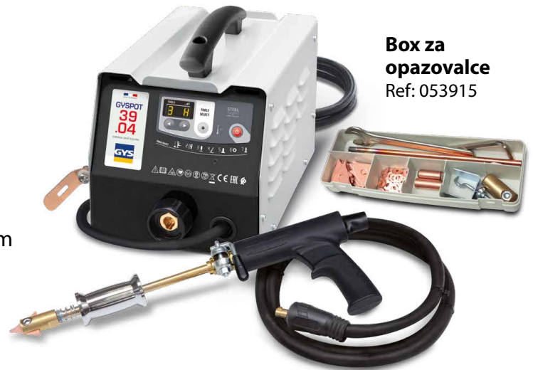
Box za opazovalce Ref: 053915

Varjenje se sproži samodejno s preprostim dotikom med orodjem in delom, ki se ravna.