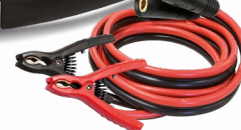
Priloženi so kabli (5 m - 25 mm 2 )