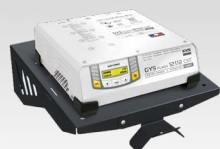
Nástenná polica 055513