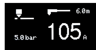
Интуитивный многоязычный интерфейс