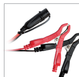
Cleme (45 cm)