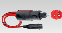
Kit isqueiro do carro 35 cm - 029439