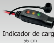
Indicador de carga 56 cm