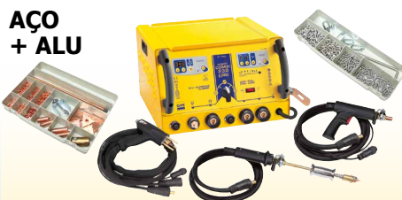
GYSPT COMBI 230 E.PRO - ref. 021266