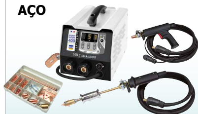
GYSPT EXPERT 200 - ref. 058842 GYSPT EXPERT 400 - ref. 058859