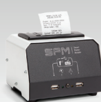
SPM : Módulo de impressão 026919