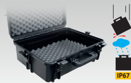
Maleta de transporte 060432