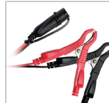
Zaciski (45 cm)