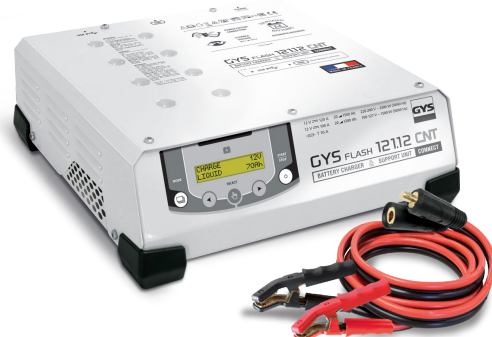
W zestawie kable (5 m - 25 mm 2 )