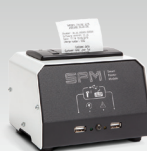
SPM : Moduł drukarki 026919