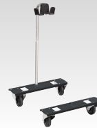
Gå på skøyter 037717