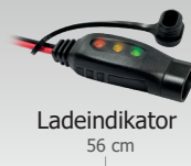
Ladeindikator 56 cm