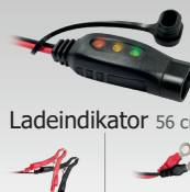
Ladeindikator 56 cm 029149