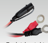
Eyelet-kontakt 45 cm - M6 029194