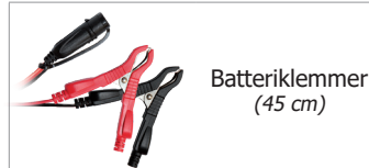
Batteriklemmer (45 cm)