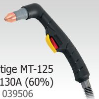
Handmatige MT-125 toorts - 130A (60%) 6m - ref. 039506 12m - ref. 039513