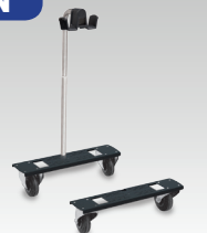
Trolley + Standaard ref. 039575