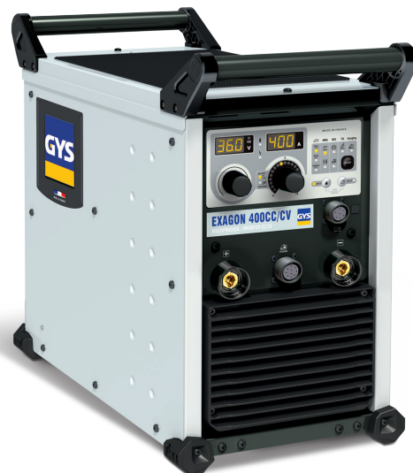
Geleverd zonder accessoires