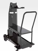
Vežimėlis PN. 041257