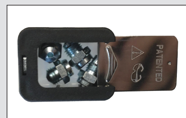
Compartimento di sistemazione delle punte