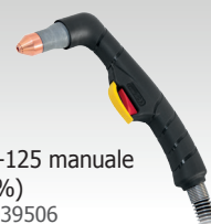
Torcia MT-125 manuale 130A (60%) 6m - ref. 039506 12m - ref. 039513