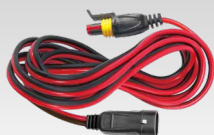
Prolunga 2.5 m - 029057