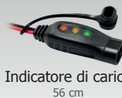
Indicatore di carica 56 cm