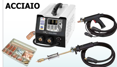
GYSPT EXPERT 200 - ref. 058842 GYSPT EXPERT 400 - ref. 058859