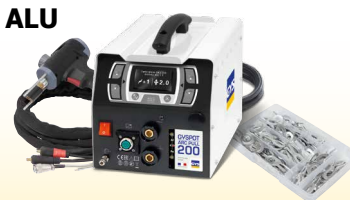
GYSPT ARCPULL 200 - ref. 057470