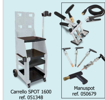
Carrello SPOT 1600 ref. 051348