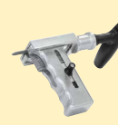
Braccio di sostegno per attrezzatura di riparazione ammaccature ref. 052284