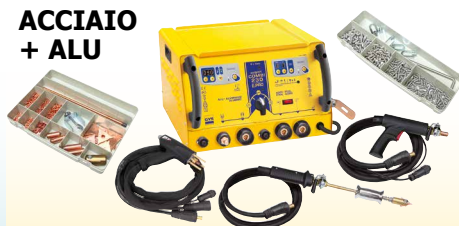
GYSPT COMBI 230 E.PRO - ref. 021266