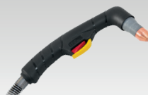
Torcia MT-70 manuale 70 A (50%) 6 m - 037502 12 m - 037519