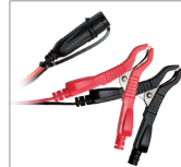
Pólus csipeszek (45 cm)