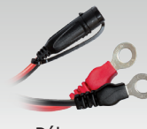
Pólus saru 45 cm - M6 029194