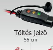
Töltés jelző 56 cm