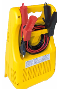
Kábelek és bilincsek tárolása az egységen belül.