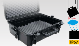
Torba za nošenje 060432