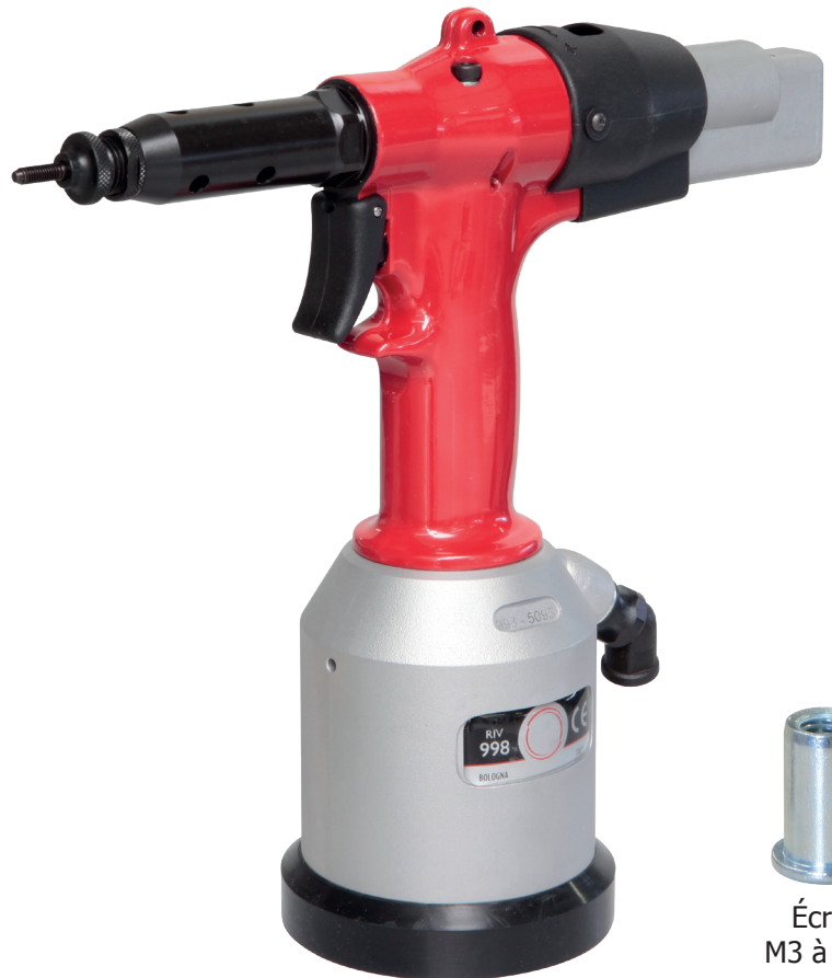
Écrou M3 à M12