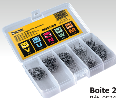
Boîte 250 agrafes Réf. 052413