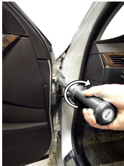
② Serrer en tournant simplement la poignée