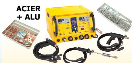
GYSPT COMBI 230 E.PRO - ref. 021266