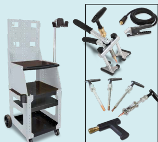
Chariot SPOT 1600 réf. 051348