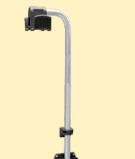
Potence pour servante de débosselage réf. 052284