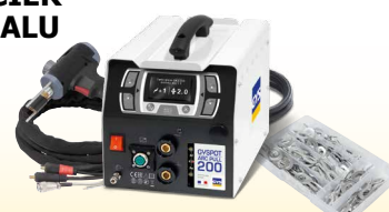
GYSPT ARCPULL 200 - ref. 057470