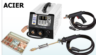
GYSPT EXPERT 200 - ref. 058842 GYSPT EXPERT 400 - ref. 058859