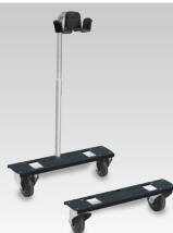
Kärky + tasapainotusjärjestelmä tuotenro 039575