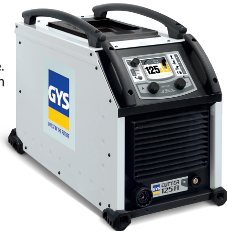
Toimitetaan maapuristimen kanssa (4m, 16 mm 2 )