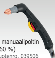
MT-125 manuaalipoltin 130 A (60 %) 6 m - tuotenro. 039506 12m - tuotenro. 039513