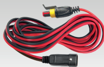
Jatkokaapeli 2,5 m - 029057