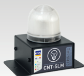
SLM : Älykäs valomoduuli 027978