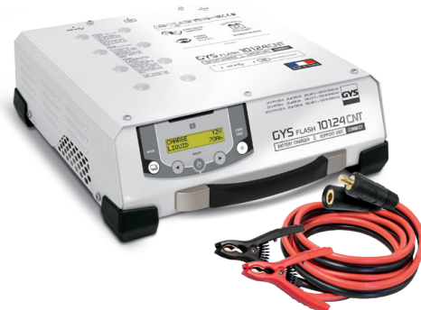
Toimitetaan kaapeleiden kanssa (5 m - 25 mm²).