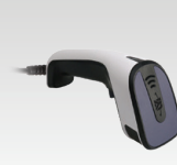
Viivakoodinlukija 1D/2D 027718