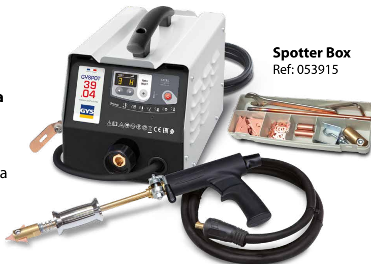
Spotter Box Ref: 053915

Keevitus käivitub automaatselt tööriista ja sirgendatava detaili lihtsa kokkupuutega.