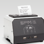
SPM : Printerimoodul 026919