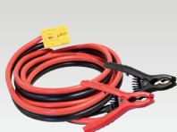
8 m - 16 mm 2 056572