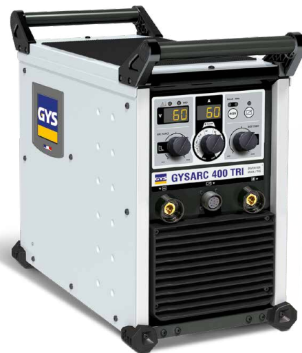
Tarnitakse ilma lisaseadmeteta