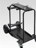
Käru 10m 3 039711