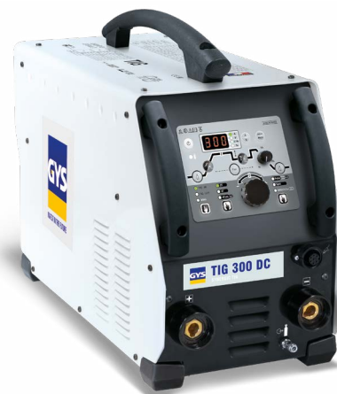
Tarnitakse ilma liseseadmeteta

■ AIP (Adjust Ideal Position) : aitab tõrvikut enne keevitust positsioneerida (4T ja 4T LOG režiimid).