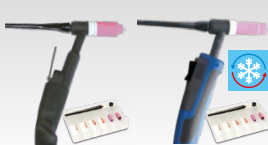
SR26 L 046184