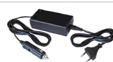
Cargador de 12 V ref. 054684