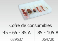
Cofre de consumibles 45 - 65 - 85 A 039537 85 - 105 A 064720