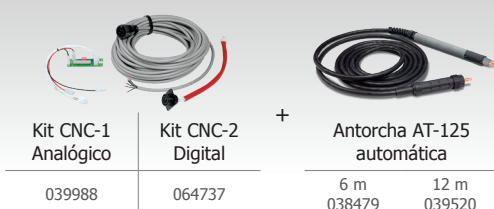
Kit CNC-1 Analógico 039988