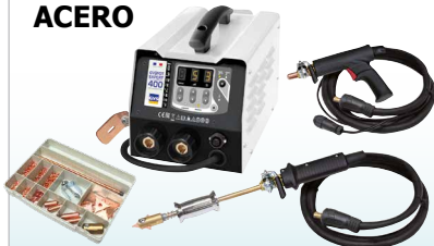
GYSPT EXPERT 200 - ref. 058842 GYSPT EXPERT 400 - ref. 058859