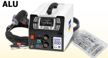
GYSPT ARCPULL 200 - ref. 057470