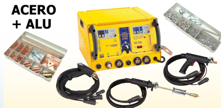
GYSPT COMBI 230 E.PRO - ref. 021266