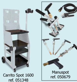
Carrito Spot 1600 ref. 051348