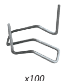
Klammern Typ M Riss von d. Aussenseite Art.-Nr. 047952