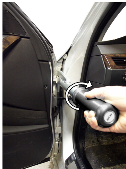
② Festziehen durch Betätigung des Drehgriffs