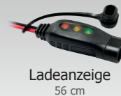
Ladeanzeige 56 cm