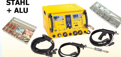
GYS SPOT COMBI 230 E.PRO - ref. 021266