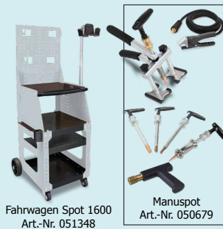
Fahrwagen Spot 1600 Art.-Nr. 051348