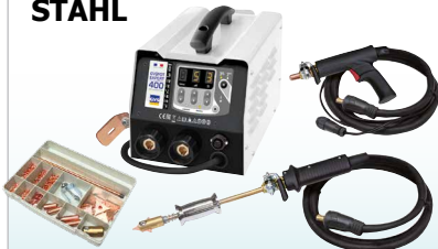
GYS SPOT EXPERT 200 - ref. 058842 GYS SPOT EXPERT 400 - ref. 058859