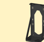
Auflageplatte für Gasflaschen 4m 3 für Fahrwagen SPOT 1600 Art.-Nr. 059665