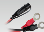
Øjekontakt 45 cm - M6 029194